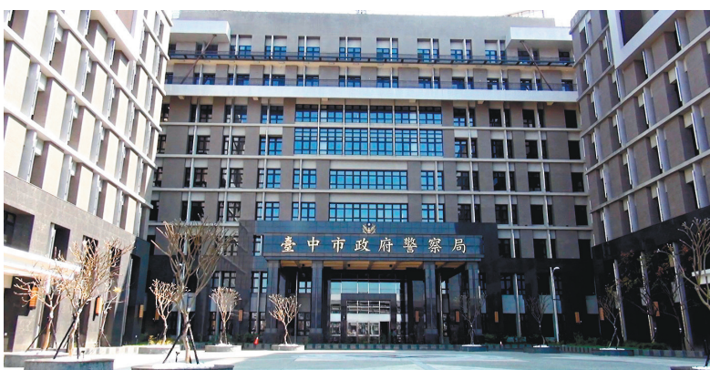
台中市警局2月底已從西屯區文心路舊址，搬遷到潭子區豐興路一段新址，3月5日舉辦落成啓用典禮。

並於新大樓B棟建置220坪「刑事鑑識中心實驗室」，屬於中部唯一國際雙認證刑事DNA實驗室，擁有自動化DNA萃取設備，降低DNA污染可能性，大幅提升刑案證物DNA鑑定效率，並設置全國首創「刑案現場重建教室」，模擬各類刑案現場，運用彈道重建、血跡噴濺及現場重建等技術，可提升偵破能量及鑑定效率。