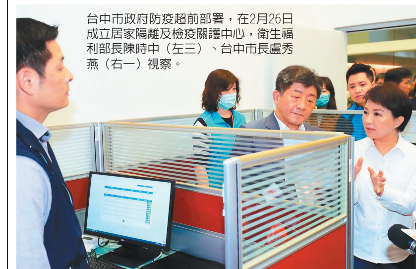
台中市政府防疫超前部署，在2月26日成立居家隔離及檢疫關護中心，衛生福利部長陳時中(左三)、台中市長盧秀燕(右一)視察。