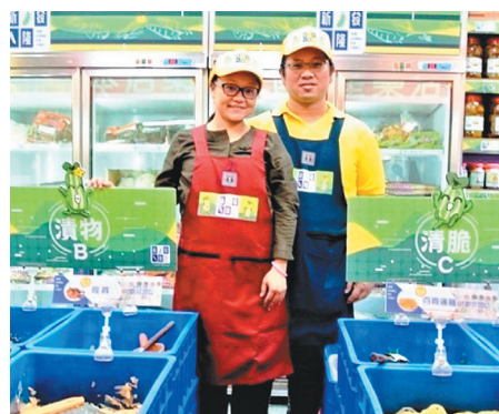
台中市政府提出6666招商計畫，廣邀青年來公有零售市場做頭家。

公有市場未使用空攤公告於經發局官方網站，歡迎上網查詢 ( https://www.economic.taichung.gov.tw/16424/Lpsimplelist )。