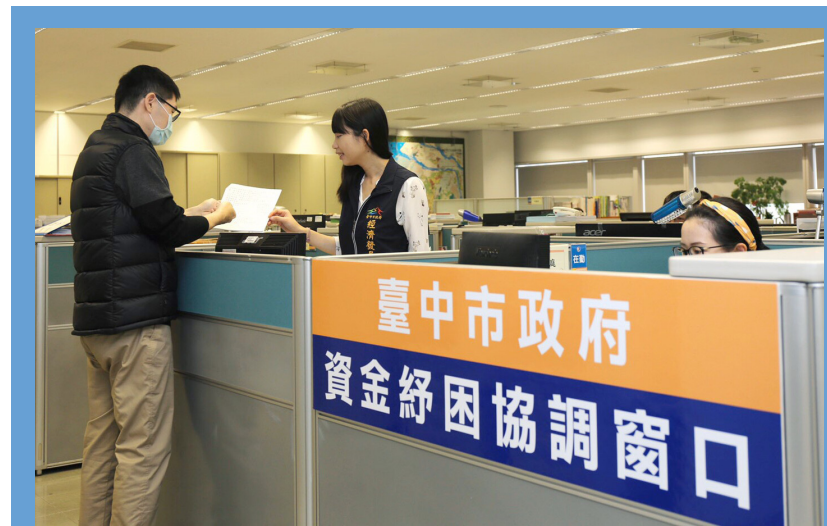
新冠肺炎疫情衝擊台灣經濟，台中市長盧秀燕宣佈「紓困九箭」，並首創全國單一「資金紓困協調窗口」，引進民間5大銀行提供貸款協助。

盧市長說，台中市沒有自己的市立銀行，要感謝二信、中信銀、台灣企銀、台灣銀行、台中商業銀行等5大銀行協助，希望讓民眾得到最有效協助，台中紓困單一窗口電話：(04) 22289111分機31139、31141、31142、31143。