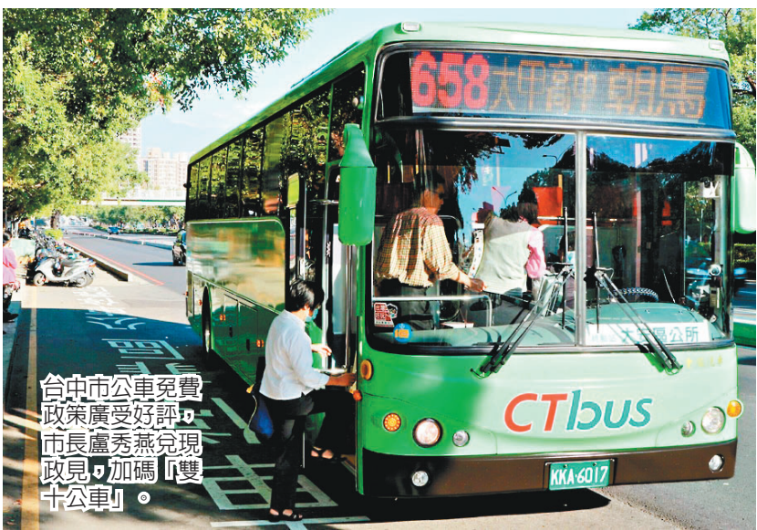
台中市公車免費政策廣受好評，市長盧秀燕現政見，加碼「雙十公車」。

居家隔離、居家檢疫民眾一份「有我在，您安心！」關護包，內含口罩、體溫計、關護中心服務資訊、市長關懷信、衛教資訊及電子書單等。關護中心位於台灣大道市政大樓文心樓一樓聯合服務中心，服務專線04-22289111分機21696、21697、21698，服務時間周一至周五上午9時至下午5時，平日晚間及假日如有需求，可洽台中市防疫專線0928-912578、0988-128807。