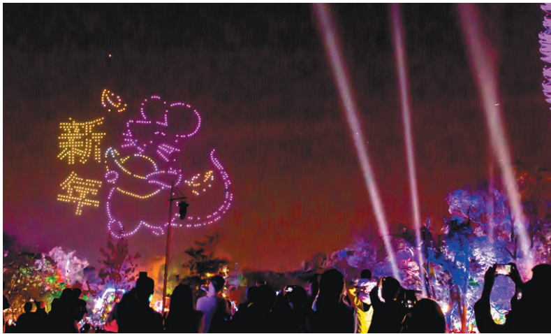
2020台灣燈會開幕後憑著口碑好評，人潮超乎預期，每晚在主展區500台的無人機展演(右圖)更成為燈會一大特色。