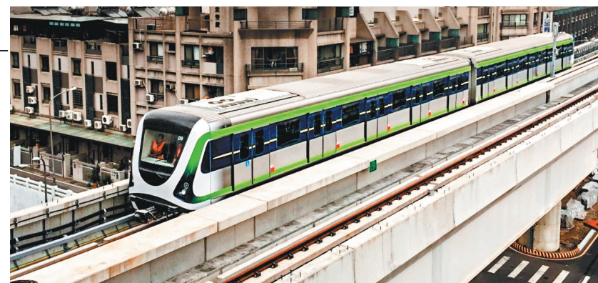
台中捷運綠線現已展開反覆測試，力保大眾運輸安全。

有了「雙十公車」，到台中的遊客只要搭乘公車，不論到谷關泡溫泉、新社看花海、造訪霧峰林家花園或梨山，統統享有「雙十」優惠，即10公里內免費、超過10公里最多只收10元，「暢遊台中只要10元，方便又幸福」！